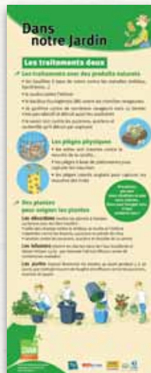
Visionnez l'expo «Les pesticides» sur Calameo

• Module 4 : Une implication citoyenne 2 panneaux