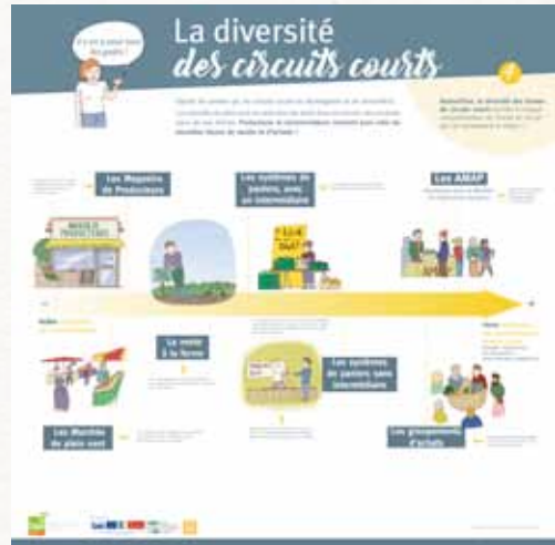
Visionnez un extrait de l'expo «Les circuits courts»