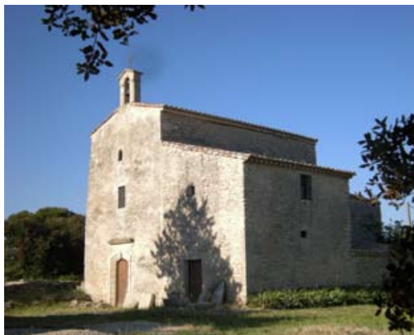
Chapelle St Nazaire

Située au sud-ouest du Gard, au bord du Vidourle, la commune d'Aubais est un lieu riche en histoire.