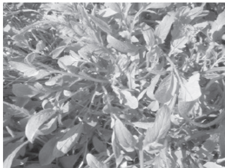
à déguster en salade ou cuite, seule ou accompagnée : la rausela, autrement dit le coquelicot.

Il s'agit de parcourir un terroir de la commune d'Aubais, près de Sommières, et d'en reconnaître les ressources autant que les limites et les problèmes.