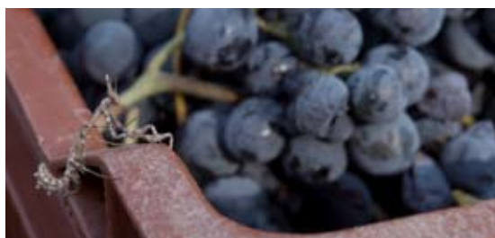
Sur la cagette : une empuse, insecte auxiliaire et prédateur d'insectes ravageurs de la vigne.