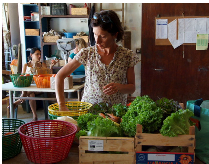
Edition Avril 2020

Pour plus d'informations et si le projet vous intéresse, contactez :