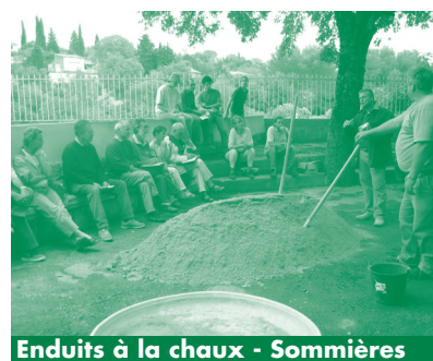
Enduits à la chaux - Sommières

Les journées et animations organisées en 2003, 2004, 2005 et 2006 ayant connu un vif succès. Nous renouvelerons ces actions de sensibilisation et de formation. Mais nous souhaitons également accompagner des projets collectifs permettant le développement des énergies renouvelables et de l'éco-habitat.