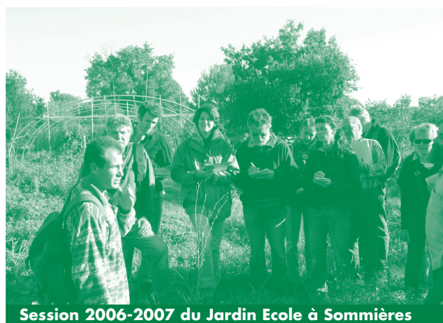
Session 2006-2007 du Jardin Ecole à Sommières

Des documents de communication sont en cours de conception : plaquettes destinées aux enfants et aux consommateurs, fiches pratiques pour jardiniers amateurs.