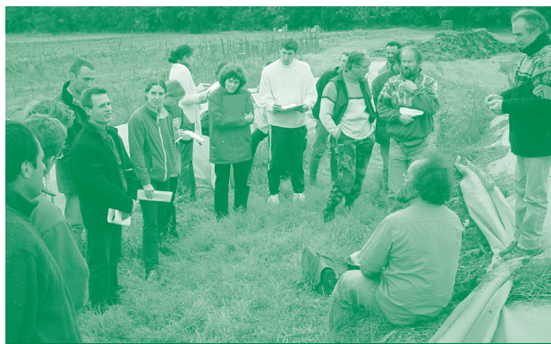
Réunion sur le site avec les partenaires

En 2006, près de 1000 tonnes sont compostées chez 4 agriculteurs. Le coût de revient pour l'agriculteur est de 10 €/t pour l'incorporation de 20 % de fumier, avec à sa charge également le coût de transport et